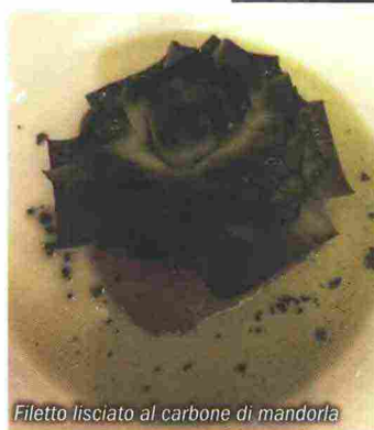
Filetto liscio al carbone di mandorla

17 generazioni, si integra perfettamente nel paesaggio. La visita ad Agrigento, la mattina seguente, ha previsto la sfilata di tutti i gruppi folkloristici nel centro storico. Per concludere il nostro viaggio abbiamo visitato il Giardino della Kolymbethra, ombroso paradiso di 5 ettari ai margini del