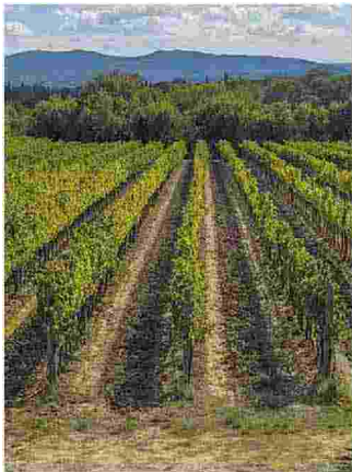
La vigna L'azienda vitivinicola